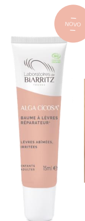
Certificirani Bio BALZAM ZA USNE

Za suhe iritacije, smiruje i pomaže obnovi kože AKTIVNI SASTOJCI: