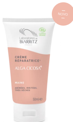
Certificirana Bio REPARATIVNA KREMA ZA RUCHE Za sve tipove kože