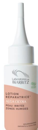
Certificirani Bio REPARATIVNI LOSION Za lice i tijelo